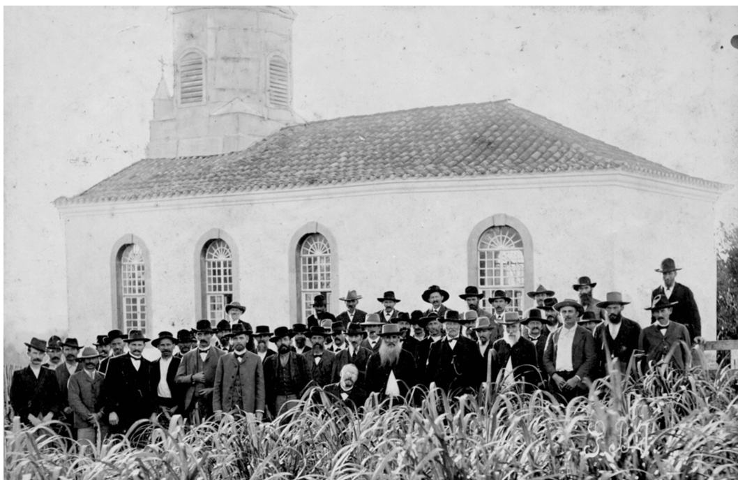
Inauguração da torre da igreja