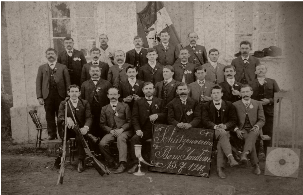
Sociedade Atiradores de Bom Jardim