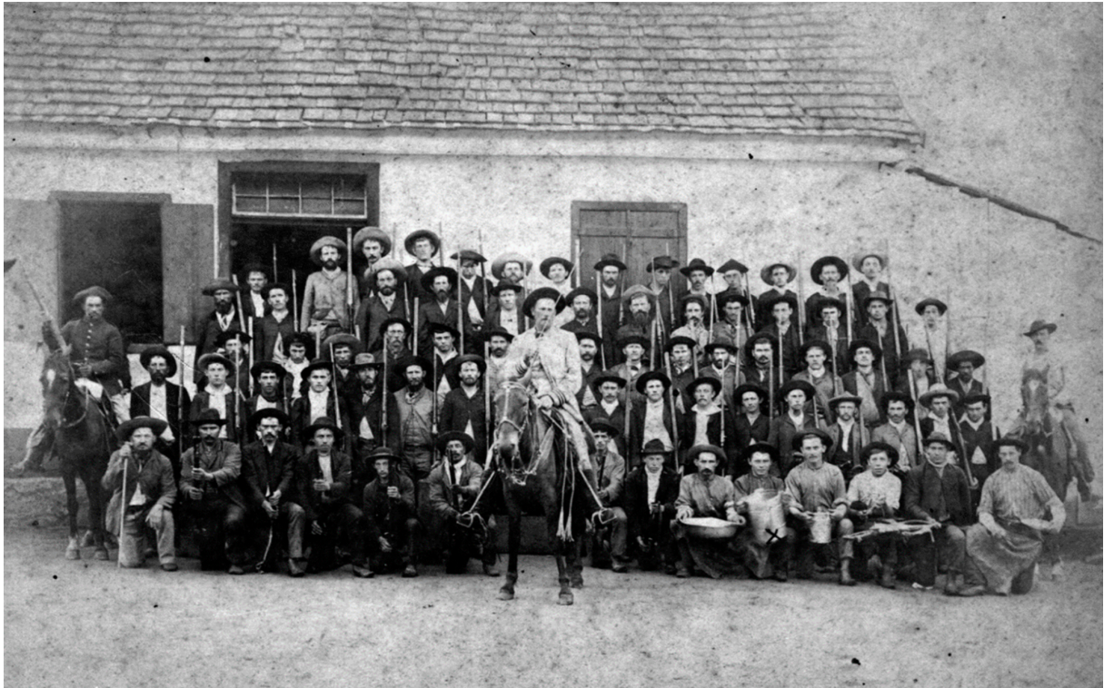
Registros históricos da comunidade de Bom Jardim