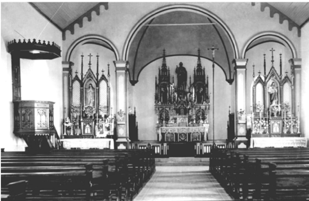
Interior da Igreja São Pedro Apóstolo